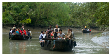
Езда на лодке в парке Сундарбан