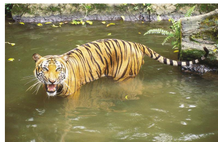
Королевский бенгальский тигр