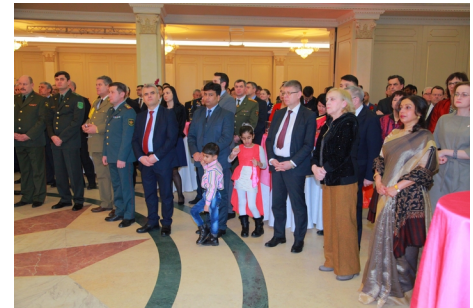
Празднование 69-й годовщины Дня Республики Индии в Алматы