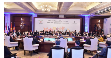
Пленарная сессия саммита АСЕАН-Индия

Премьер-министр Хун Сен принял участие в деловой встрече, организованной FICCI. Он посетил Центр электронного управления Министерства электроники и ИТ и выразил признательность индийским ИТ-специалистам в области сельского хозяйства. Премьер-министр Моди выразил готовность Индии оказать Камбодже помощь в связанных с сельским хозяйством ИТ-приложениях, включая карты здоровья почв для фермеров и создание электронного национального рынка сельского хозяйства. Четыре соглашения были подписаны в ходе визита по программе культурного обмена, кредитная линия на сумму 36,92 млн. Долл. США для финансирования проекта развития водных ресурсов Сунгвава Хаба, взаимной правовой помощи по уголовным делам и предотвращению торговли людьми.