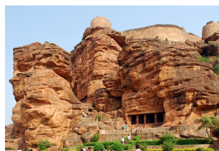
Храмы пещеры Бадами