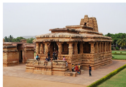
Храм Айхол Дурга