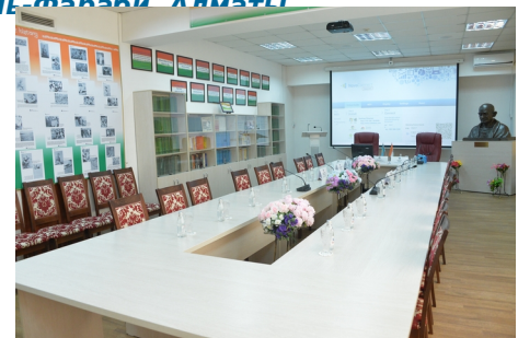
Празднование Вишва Хинди Дивас в Алматы