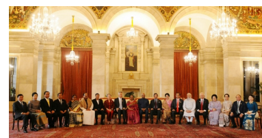
Президент Индии встретился с лидерами АСЕАН