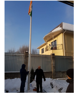
Празднование 69-й годовщины Дня Республики Индии в Астане