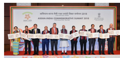
Лидеры выпустили памятные марки