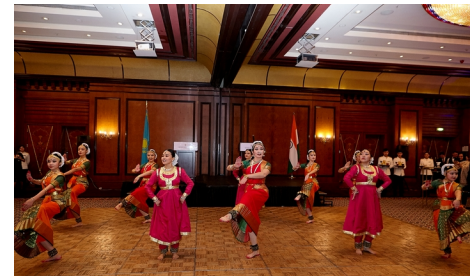
Открытие Центра им. Махатмы Ганди в Казахском национальном университете им. Аль-Фараби, Алматы