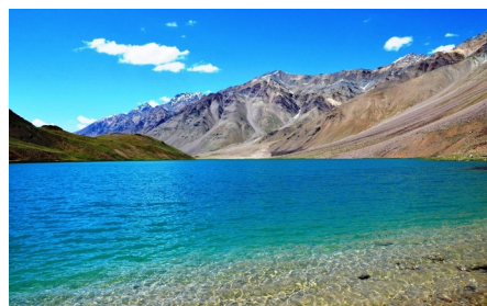
Чандра Тал Лейк