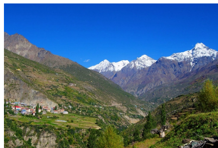
Горное спокойствие на холмах в Лахауле и Спити