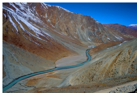
Река Чандра возле перевала Кунцум