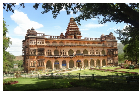
Раджа-Махал в Чандрагири Форте