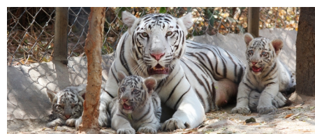
Зорический парк Шри Венкатешвара