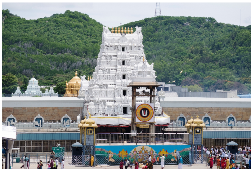
Храм лорда Венкатешвара

Озеро Свами Пушкарини, храм Шри Говиндарая Свами, водопады Капила Теертам, храм Падмавати, Храм Аламелуманга, Нараянаванам и водопады Кайласанатхакона - некоторые из других важных достопримечательностей в Тирупати и вокруг него.