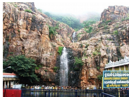
Водопады Капила Теертам